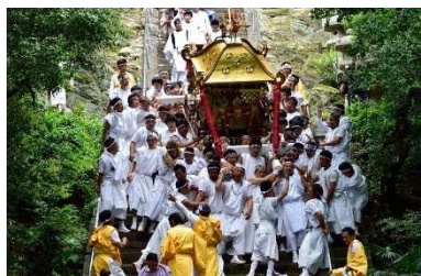
祭の見せ場である神輿 下ろしの風景