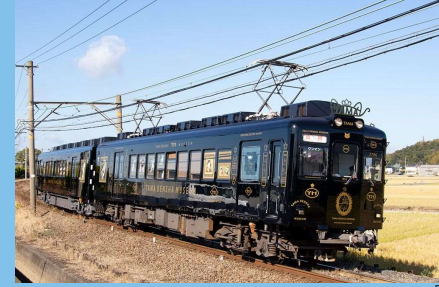
わかやま電鉄貴志川線