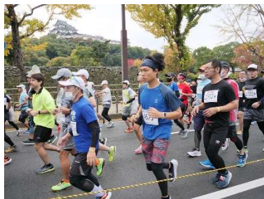
和歌山城前スタート地点