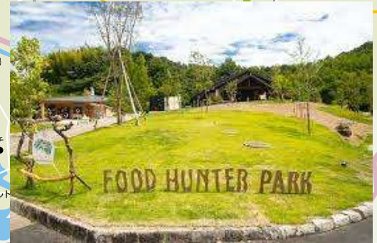
道の駅 四季の郷公園 『FOOD HUNTER PARK』