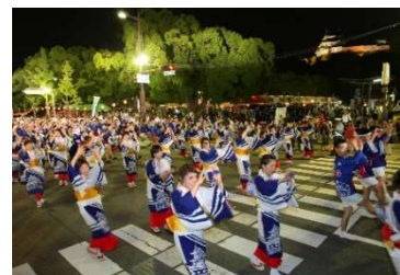
壮麗なおどり風景