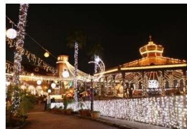
光のメリーゴーランド